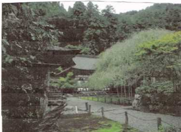
常照皇寺 (京都市右京区京北井戸町丸山)