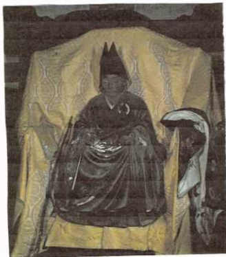
光厳院木像 (常照皇寺蔵/写真の映美社撮影)