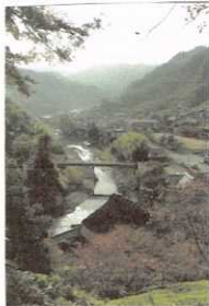
賀名生の里 (奈良県五條市西吉野町賀名生)