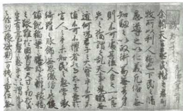
「誠太子書」巻頭部分(宮内庁書陵部蔵)