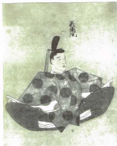
花園天皇俗體宸影