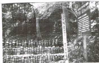
六波羅探題 北条仲時公および従士の墓