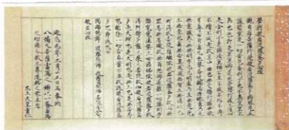
「般若心経 光厳天皇宸翰」(重要文化財、香川県立ミュージアム蔵)