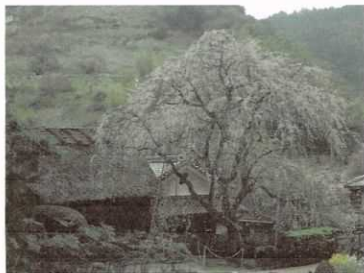
福家住宅(賀名生皇居跡)